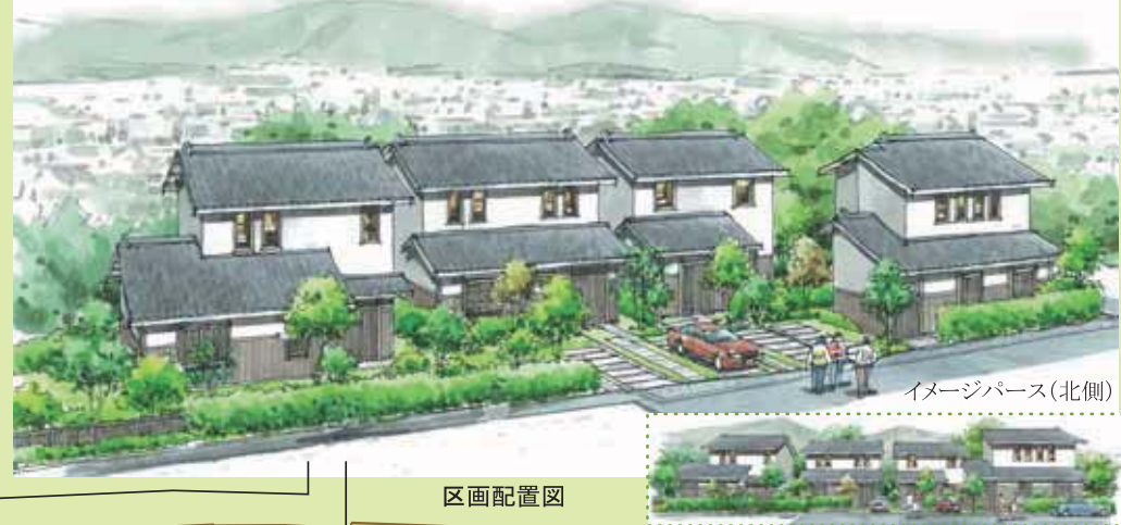
イメージパース(北側)