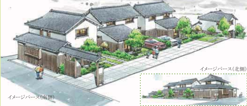
イメージパース(北側)