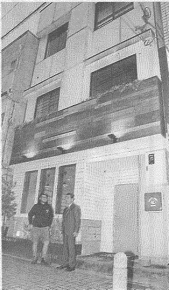
福知山駅前の活性化に役立てようと、空きビルを改装したゲストハウスフース・フロント・ホテル